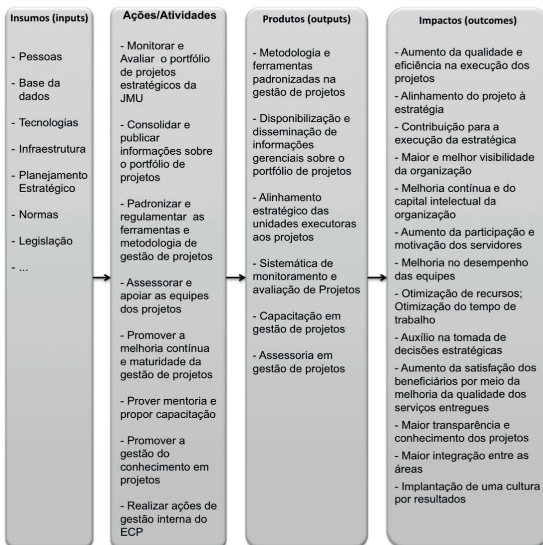
Figura 40 - Cadeia de Valor do ECP

A seguir, na Figura 40, é apresentada a cadeia de valor do ECP.