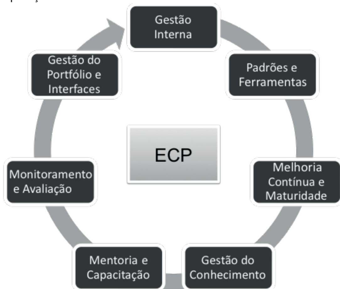
Figura 41 - Modelo de Operação do ECP

melhoria contínua e maturidade; gestão do conhecimento; mentoria e capacitação; monitoramento e avaliação; e gestão de portfólio e interfaces. Cada serviço foi objeto de detalhamento em termos de objetivos, resultados esperados, processos, responsabilidades e periodicidade de realização. A Figura 41 representa o Modelo de Operação do ECP.